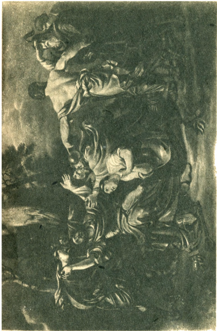
Дмитрий Донской на Куликовом поле. (С марьяны О. Кипренского.)