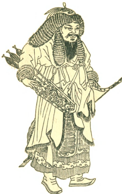
Чингис-хан. (С китайского портрета.)

имел при себе пилку для затачивания стрел (острия их, кроме того, закалялись в огне и затем заливались водой с солью), имел также иголки, нитки и сито для процеживания мутной воды.