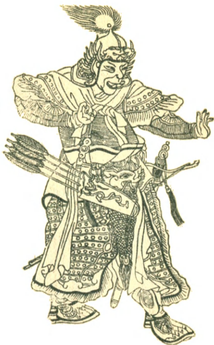
Субэдэ, полководец Чингис-хана. (С китайского портрета.)

Монголо-татарские воины были искусными стрелками из лука: на полном скаку они поражали врага без промаха и одинаково ловко спускали тетиву правой и левой рукой.