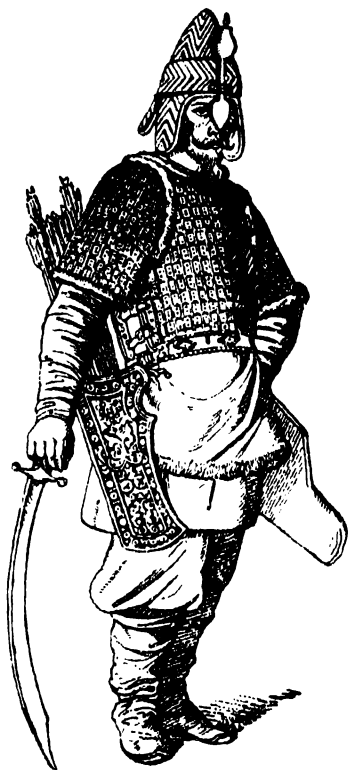
Тип русского воина.

А впереди русского войска давно уже выслеживали татар и приглядывались к местности два сильных сторожевых отряда. Дмитрий послал их «под самую орду Мамаеву» добывать вестей. Вести же были такие, что Мамай не торопится, так как ждет прихода Ягайло, и тянет