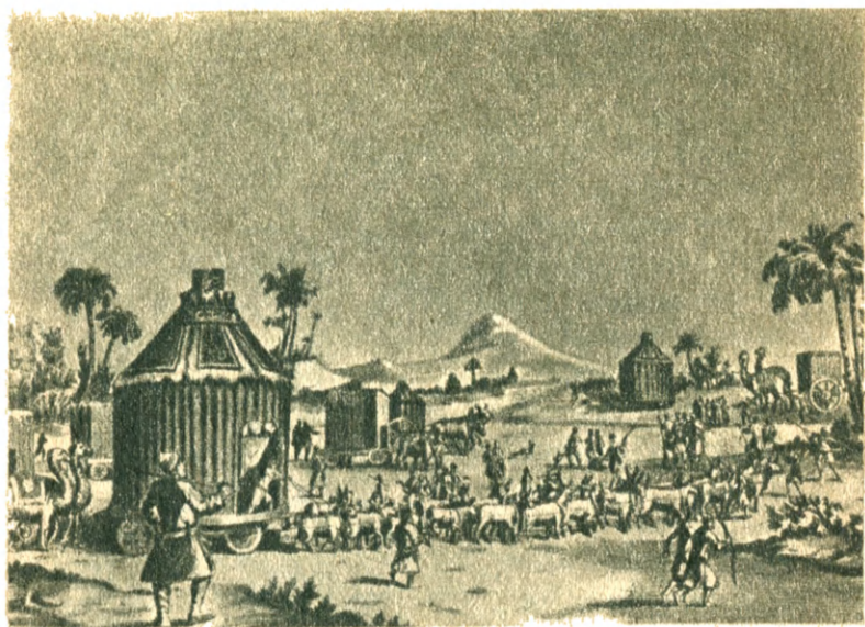
Монголо-татарские кибитки. (Из книги «История монголов» Плано Карпини.)

Они строили пирамидальные башни, иногда достигавшие высоты шестидесяти метров, и, взбираясь на них, наблюдали за жителями осажденных городов.